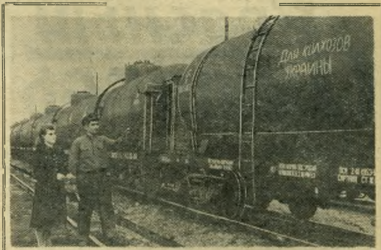
Грозный. Ежедневно со станции Грозный в разные концы нашей Родины отправляются тысячи тонн бензина, керосина, лигроина и смазочных масел.

Книга имеется в продаже в магазине Сызранского отделения Книготорга.