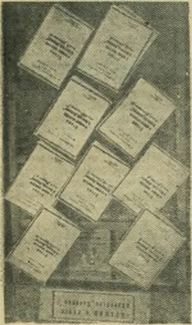
НА СНИМКЕ: стенд с отзывами читателей о романе В. Кочетова «Журбины».

Читательская конференция в нефтяном техникуме по роману „Журбины“ В. Кочетова