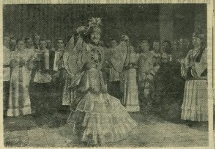
Алма-Ата. Большим концертом в Казахском государственном академическом театре оперы и балета имени Абая закончился республиканский смотр сельской художественной самодеятельности. В смотре приняло участие более 20 тысяч колхозников, учащихся и представителей сельской интеллигенции.