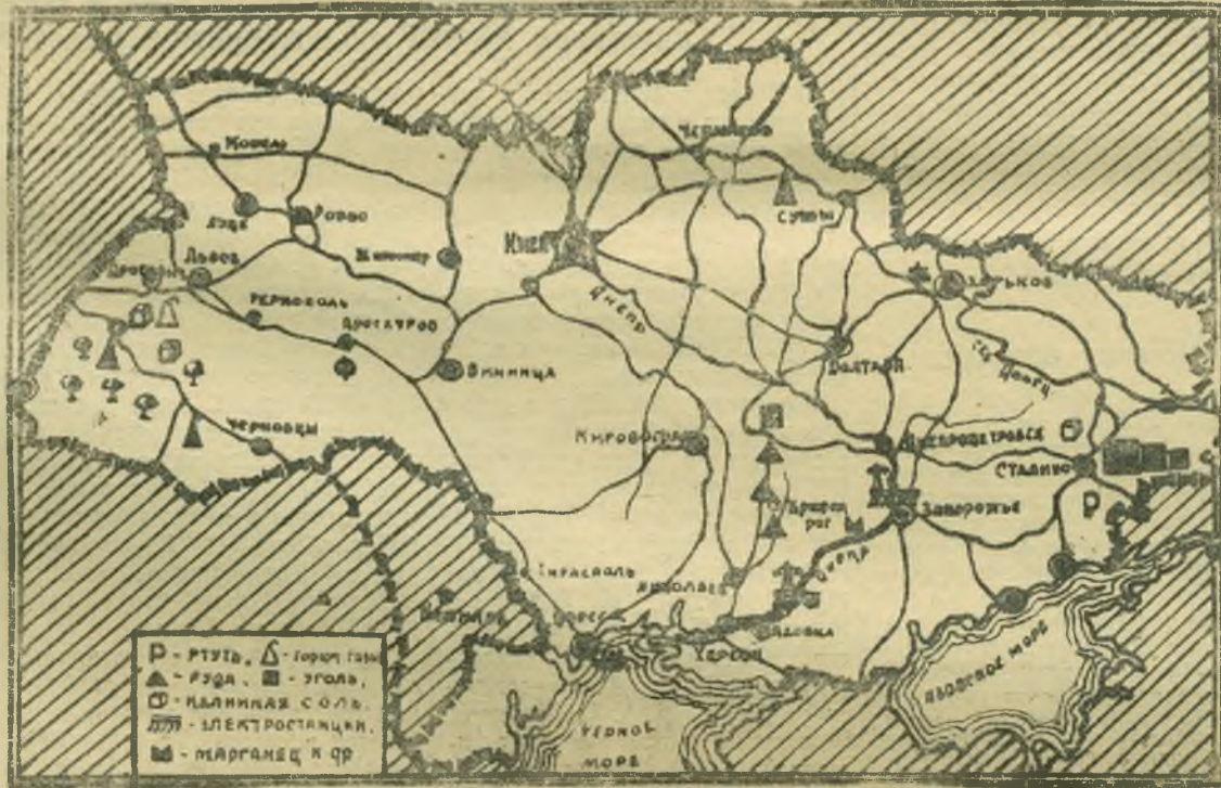
Карта Украинской Советской Социалистической Республики.

На Украине работает около 28 тысяч клубов, дворцов и домов культуры, из них около 9 тысяч колхозных, более 32 тысяч массовых библиотек, 84 музея, 7.390 киноустановок.