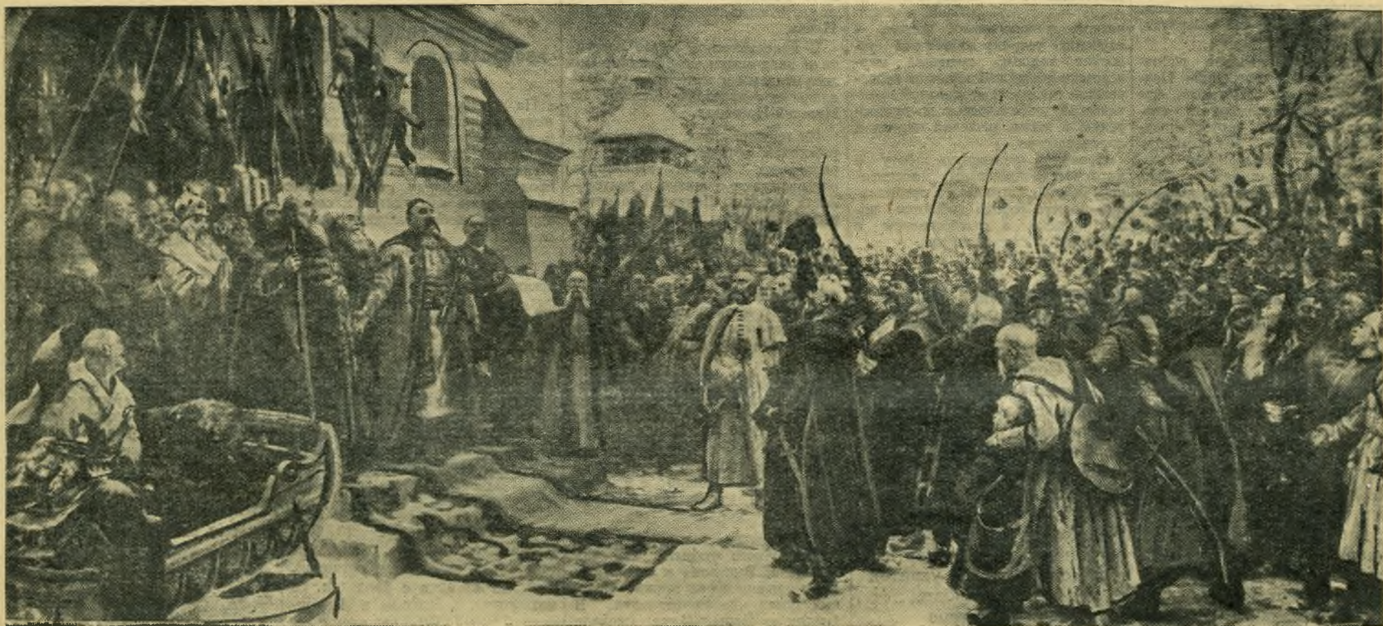
Картина художника лауреата Сталинской премии М. И. Хмелько «Навеки с Москвой, навеки с русским народом», 1952 год (масло).

ковой была прочитана лекция «Трехсотлетие воссоединения Украины с Россией».