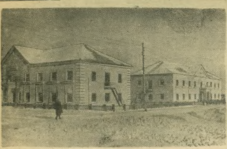
В конце прошлого года на Кашпирском сланцевом руднике сданы в эксплуатацию два двухэтажных благоустроенных общежития.