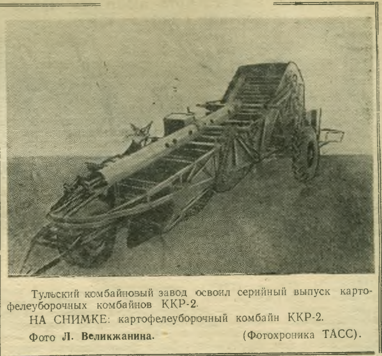
Тулский комбайновый завод освоил серийный выпуск картофелеуборочных комбайнов ККР-2.

25 марта XII съезд ВЛКСМ продолжал работу. (ТАСС).