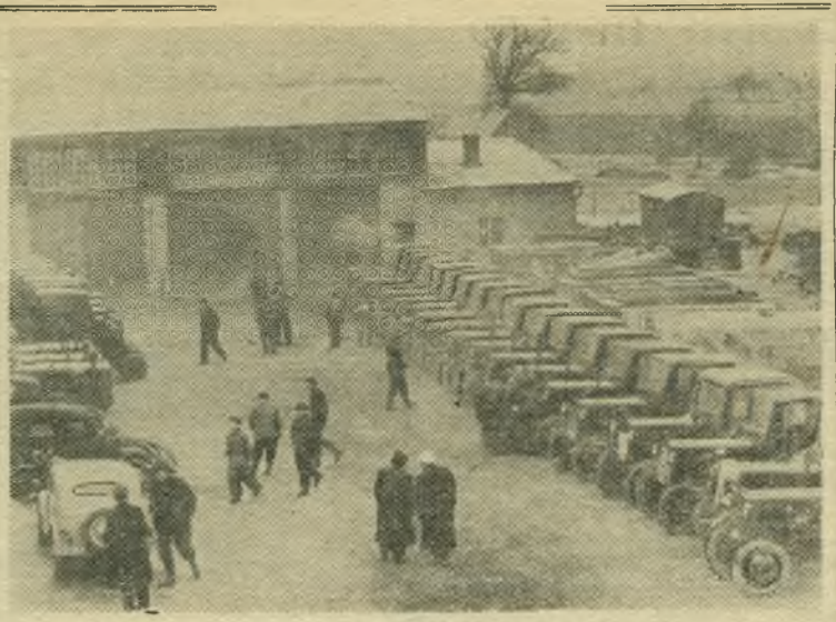
В Германской Демократической Республике проводится усиленная подготовка к весенним полевым работам. НА СНИМКЕ: отремонтированные тракторы Рейхштадской машинно-тракторной станции (в районе Дрездена).

вые земли, Алтай это — благородное дело. Почему оно должно нас разделять? И ты... если ты уходишь туда, разве делаешь плохо. Зачем же нам расставаться? Лида ласково тронула Владимира за рукав. — Милый, зачем говорить друг другу «прощай»? Я решила лучше вместе. — Так значит... радость, охватившая Владимира, мешала ему говорить — Ты будешь ждаться, пока я... — Ты все еще не понял. — Лида рассмеялась — Я не буду ждать. Я тоже поеду туда! Сегодня скажу маме; а завтра пойду прямо в райком. Володя, мы будем рядом. Счастье и несчастье — пополам. — Лида, так вот ты какая! — только и сказал Владимир. — А ты думал — другая? — Лида, прости, я не знал. Значит — вместе? — Вместе, — повторила Лида. — Пойдем, Володя. На углу встретился празднично одетый Литвинов. Он хитро подмигнул: — Прощаемся... Хорошее дело. Погодите... озадаченно протянул он. — Что-то непохоже. Лида, вы почему такая веселая? — Мы не прощаемся, — улынулся Владимир. Лида счастливо засмеялась: — Мы уезжаем... вместе!