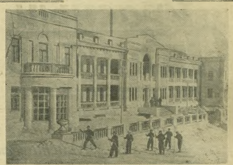
Саратовская область. Недавно близ Саратова в живописной местности открылся дом отдыха ВЦСПС. Новая здравница рассчитана на 150 человек.