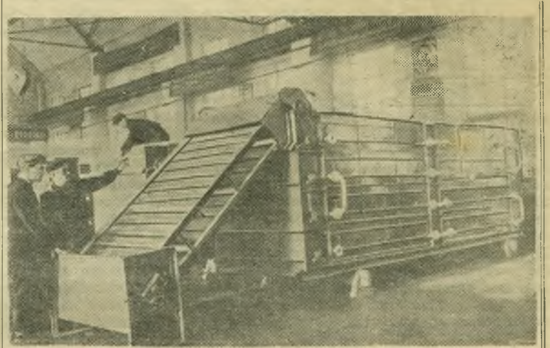
Горький. На машиностроительном заводе имени Воробьева выпускаются различные машины для пищевой промышленности. Среди них — паровая конвейерная сушилка овощей. Ее производительность до 700 килограммов сухих овощей в сутки.