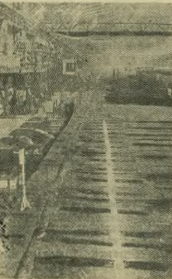
Аньшаньский комбинат — крупнейшее предприятие металлургической промышленности Китайской Народной Республики. Недавно строители комбината

та добились новых выдающихся успехов. Они пустили в эксплуатацию два крупных цеха — трубноркатный и рельсо-балочный, а также доменную печь. Продукция этих цехов пойдет на предприятия, выпускающие суда, паровозы, нефтяное оборудование. В цехах установлено современное оборудование, поступившее из Советского Союза.