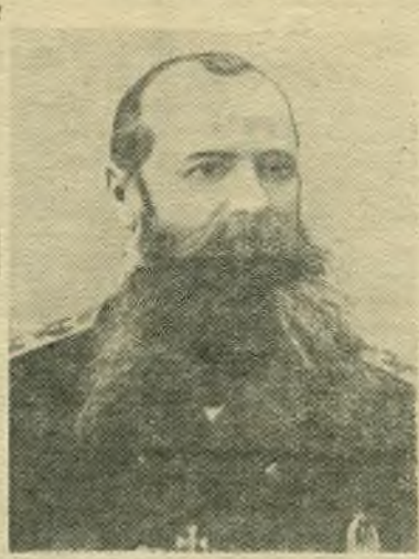
13 апреля 1954 года исполнилось 50 лет со дня гибели выдающегося русского флотоводца С. О. Макарова (1849—1904).