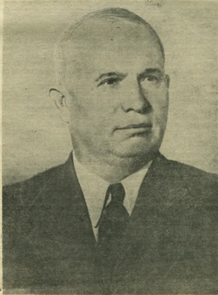
Н. С. ХРУЩЕВ

На спектакле присутствовали товарищи Г. М. Маленков, В. М. Молотов, Н. С. Хрущев, К. Е. Ворошилов, Н. А. Булганин, Л. М. Каганович, А. И. Микоян, М. Г. Первухин, П. Н. Поспелов. В театре присутствовал Чрезвычайный и полномочный посол Франции в СССР Л. Жокс.