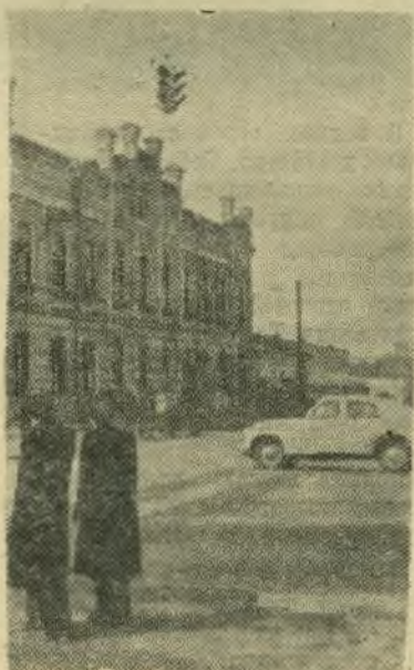
В целях улучшения движения автотранспорта в городе на перекрестках улиц устанавливаются светофоры.

Всеобщее внимание привлекают иллюстрации монтажа. Среди них цветные репродукции с картин С. Григорьева «Прием в комсомол», В. Куракина — «Отчет пионервожатой на педсовете».