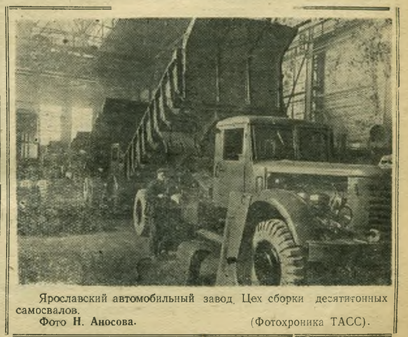
Ярославский автомобильный завод. Цех сборки десятитонных самосвалов.

На днях магазином получено для продажи населению 22 тонны водопроводных труб и 35 паровых котлов.