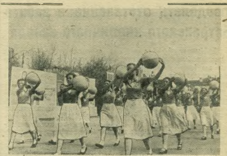
ПРАЗДНОВАНИЕ 1 МАЯ В СЫЗРАНИ. НА СНИМКЕ: колонна учащихся 22-й железнодорожной школы.