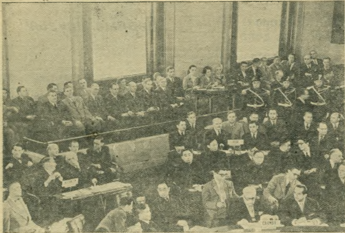
Женевское совещание министров иностранных дел. НА СНИМКЕ: делегации Советского Союза, Китайской Народной Республики и Англии в зале заседаний.