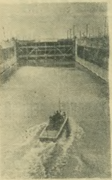
Молотов. Строители Камской ГЭС к всенародному празднику 1 Мая закончили сооружение судоходного шлюза и провели по нему пробные катеры. Через несколько дней здесь пройдут уральский лес суда, груженные промышленными и продовольственными товарами.

НА СНИМКЕ: катер № 20 в судоходном шлюзе.