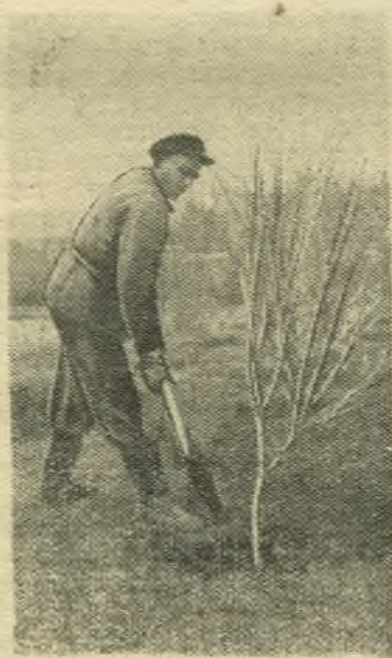
В детском парке в этом году произведена посадка новых деревьев и кустарников.