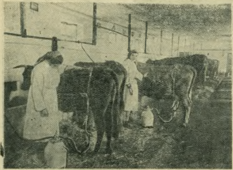
Народная Республика Болгария. На животноводческих фермах в трудовых кооперативно-земледельческих хозяйствах внедряется механизация. В кооперативном хозяйстве имени С. М. Кирова в селе Шабла введена электродойка коров. НА СНИМКЕ: на животноводческой ферме.