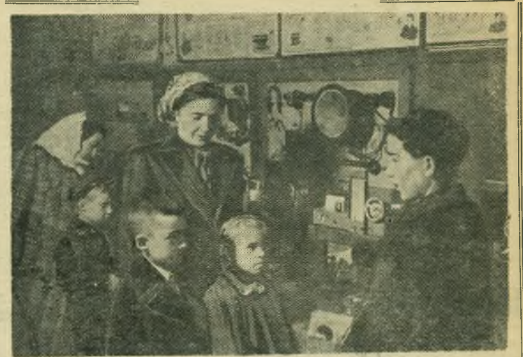
9 мая во Дворце пионеров открылась выставка детского творчества, пользующаяся большой популярностью у трудящихся города. Особенно много посетителей в комнатах, где размещены экспонаты радиотехнического и рукодельного кружка.

Собрание комсомольского и физкультурного актива по обсужденному вопросу приняло постановление, в котором намечены мероприятия по дальнейшему подъему физкультурной работы на Сызранском железнодорожном узле.