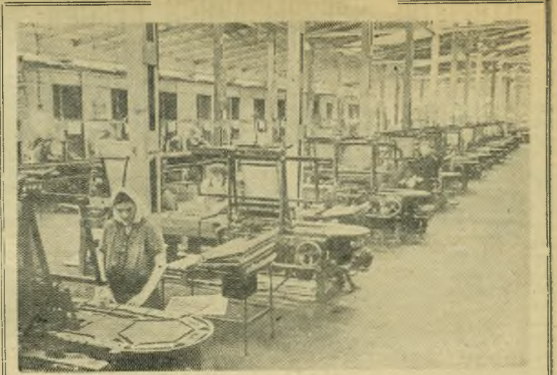
Башкирская АССР. На Черниковской спичечной фабрике имени 1-го Мая все процессы автоматизированы. За сутки с конвейера сходит до трех миллионов коробок спичек. Коллектив фабрики обязался выполнить годовой план к 15 декабря и дать дополнительно 25 тысяч ящиков спичек. План четырех месяцев выполнен досрочно.

Обеспечим успешное выполнение принятых обязательств.