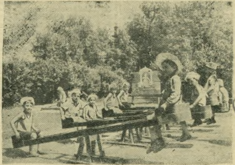
НА СНИМКЕ: в детском парке.