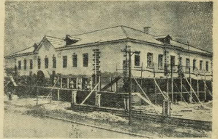
НА СНИМКЕ: Новая школа № 28. В здании ведутся отделочные работы.

Обобщая и распространяя опыт работы по воспитанию коммунистов на партийных поручениях, партком завода будет способствовать повышению активности коммунистов и устранению недостатков в этом важном деле.