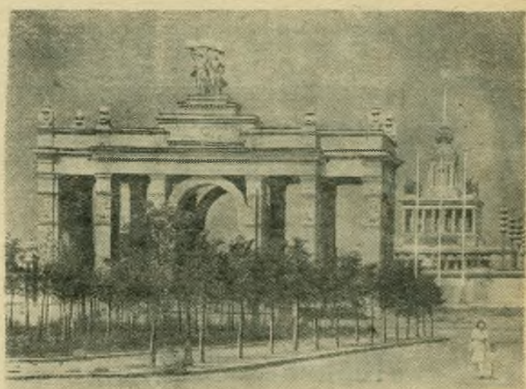
Москва. Всесоюзная сельскохозяйственная выставка. Главный вход.

ИВАНОВО. (ТАСС). Здесь началось строительство завода гальванических батарей. Предприятие, оснащенное новейшей техникой, будет выпускать ежегодно 200 тысяч батарей для питания радиоприемников в неэлектрифицированных местностях, 400 тысяч запасных элементов к ним, а также 7,5 миллиона батареек для карманных фонарей.