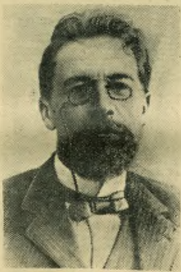
А. П. Чехов.

Чехов бичевал обывательщину, мешанство, застои и удушье в общественной жизни. Особенной силой отличаются такие его повести и рассказы, как «Палата № 6», «Крыжовник», «Человек в футляре», «Ионыч» и другие. «Палата № 6» была воспринята современниками как типическое изображение тюремного режима царской России. Повесть эта произвела огромное впечатление на молодого В. И. Ленина.