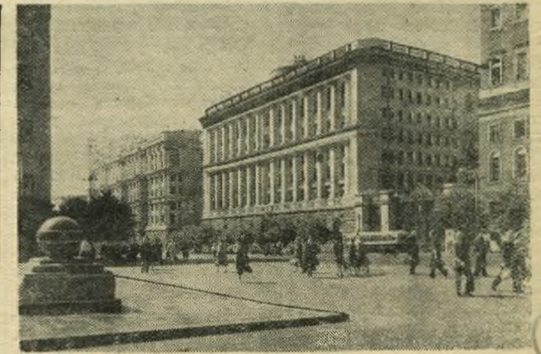
Москва сегодня. На улице Горького.

Для полива полей используются воды Днепра. Впадающая в Днепр мелкозодная река Ингулец на протяжении более 80 километров потечет вспять, понесет днепровскую воду к мощной насосной станции, воздвигаемой южнее Снигиревки.