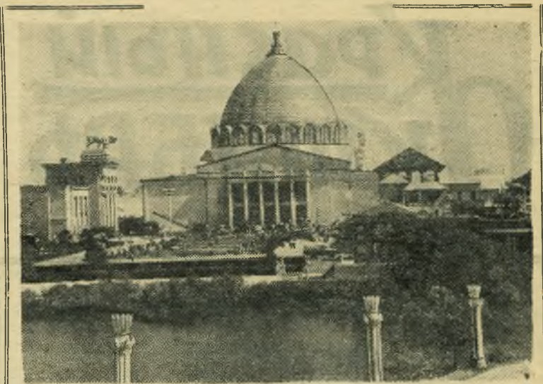
Москва. Всесоюзная сельскохозяйственная выставка. Вид на павильон механизации и электрификации сельского хозяйства СССР.

Книга имеется в продаже в магазинах и киосках Книготорга.