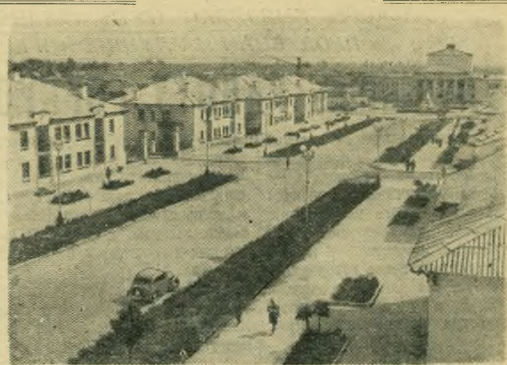
Азербайджанская ССР. Вид на проспект имени Сталина в Мингечауре.

МОНТЕВИДЕО, 16 июля. (ТАСС). Как сообщает газета «Коррейо да Манья», на днях в Рио-де-Жанейро по инициативе врачей федерального округа начался цикл лекций и дискуссий о социальном положении населения и состоянии здравоохранения в Бразилии. Во вступительной речи председатель организации ООН по вопросам продовольствия сельского хозяйства автор известной книги «География голода» Жозе де Кастро заявил, что Бразилия является страной сплошного недоедания. Одни районы страны, сказал он, отличаются от других лишь интенсивностью голода. Так, например, северо-восток и Амазония — это районы постоянного голода. Во внутренних районах голод носит эпидемический характер. В остальной части Бразилии царит недоедание.