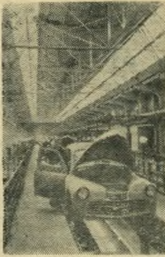
Горький. Автозавод имени В. М. Молотова. Эстакадный конвейер сборки легковых автомобилей «Победа».