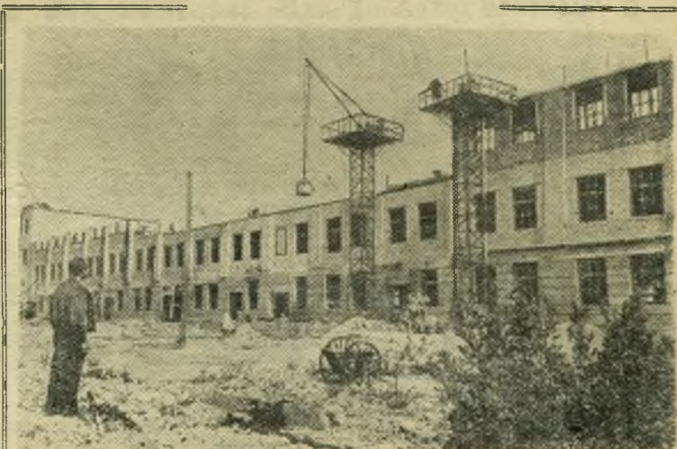
Эстонская ССР. В городе Пярну строится новый рыбоконсервный завод. Это будет самое большое предприятие в Прибалтике по переработке рыбы. Его цехи оснастятся новым автоматическим отечественным оборудованием. Предприятие войдет в строй в 1955 году.