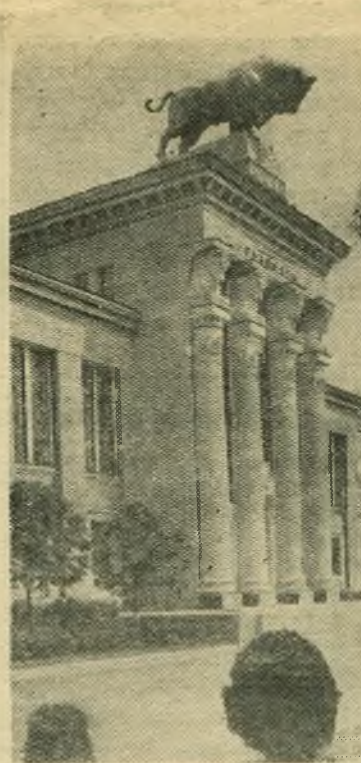
Москва. Всесоюзная сельскохозяйственная выставка.

ГОРЬКИЙ, 20 июля. (ТАСС). Коллектив земснаряда № 315, работающий на строительстве Горьковской ГЭС, снял перемычку между обводным каналом и Волгой. Воды великой русской реки устремились в русло канала. «Москвич».