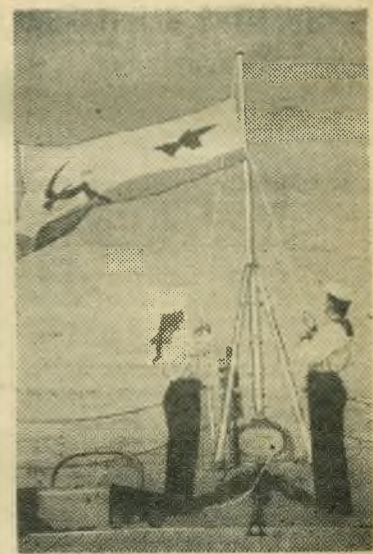
Подъем флага на корабле.

Как всенародный праздник отметили День Военно-Морского Флота СССР трудящиеся нашей Родины. Народные гулянья, соревнования спортсменов, беседы и лекции, посвященные празднику, состоялись в Киеве, Минске, Петрозаводске, во многих других городах и населенных пунктах.