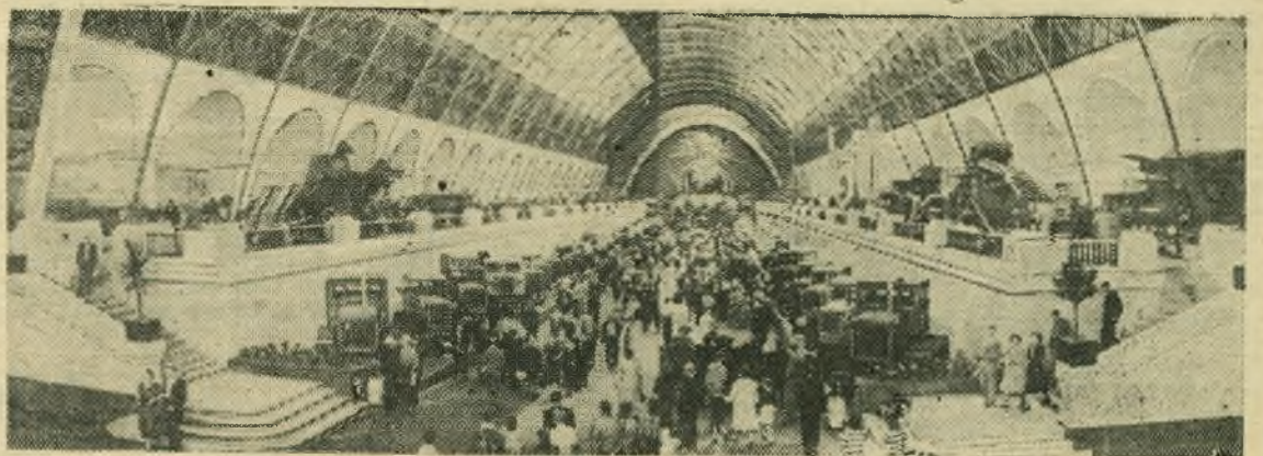
Москва. Всесоюзная сельскохозяйственная выставка. НА СНИМКЕ: в павильоне Механизации и электрификации сельского хозяйства.

В этом году горпищекомбинатом из ягод собственных садов будет сварено варенья в два раза больше чем в прошлом году.