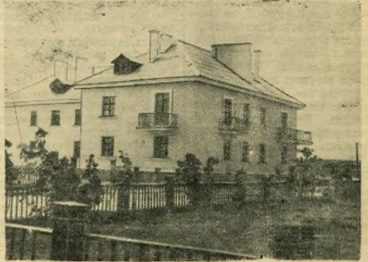
В поселке «Строитель» недавно сдан в эксплуатацию 12-квартирный жилой дом. НА СНИМКЕ: Новый 12-квартирный жилой дом в поселке «Строитель».

Сейчас строится еще несколько домов для рабочих деревообделочного комбината.