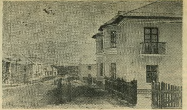
Быстро растет поселок рабочих деревообделочного комбината треста «Востокнефтьстройматериалы».

НА СНИМКЕ: общий вид улицы рабочего поселка.