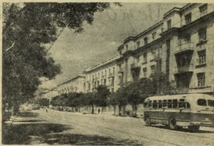
Тбилиси. Новые жилые дома на улице Шаумяна.

Ф. Логинов, механик испытательной группы цеха № 21.