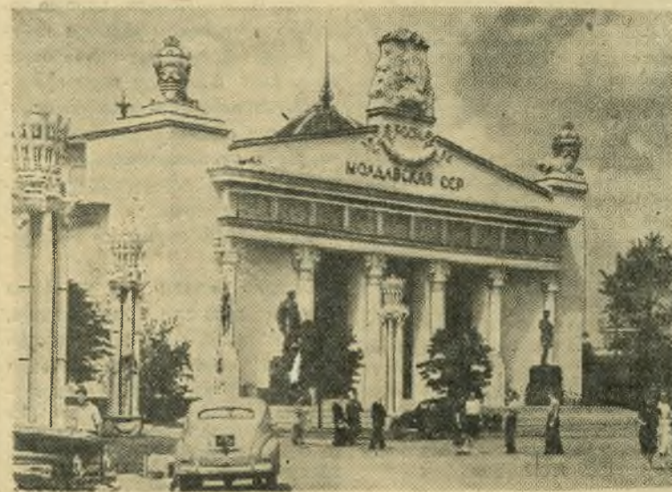
Всесоюзная сельскохозяйственная выставка. Павильон «Молдавская ССР».

На его четырех факультетах и заочном отделении занимается около тысячи студентов — в основном дети рыбаков, шахтеров, лесорубов, нефтяников.