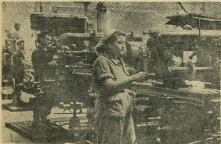
В Народной Республике Болгарии на фабриках и заводах ширится движение за перевыполнение производственных норм.

ПХЕНЬЯН, 6 сентября. (ТАСС). На днях состоялся выпуск студентов, окончивших Вонсанский сельскохозяйственный институт. 99 молодых специалистов сельского хозяйства будут работать в качестве агрономов, животноводов, лесоводов, ветеринаров и экономистов.