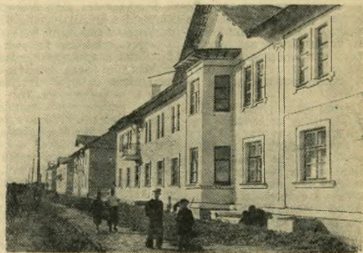
В районе гидротурбинного завода построен поселок из двухэтажных каменных многоквартирных домов. В нем живут рабочие, инженеры, техники и служащие завода.

НА СНИМКЕ: улица имени Гоголя в новом поселке гидротурбинного завода.