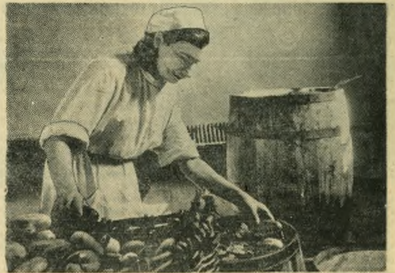
Городской пищекомбинат заготовил в колхозах и засолил на зиму 24 тонны огурцов вместо 22 по заданию.

Государственным издательством политической литературы выпущена в свет новая брошюра: С. Новалев. «В чем состоит коммунистическое воспитание трудящихся». Москва 1954 г. Брошюра имеется в продаже в книжных магазинах города.