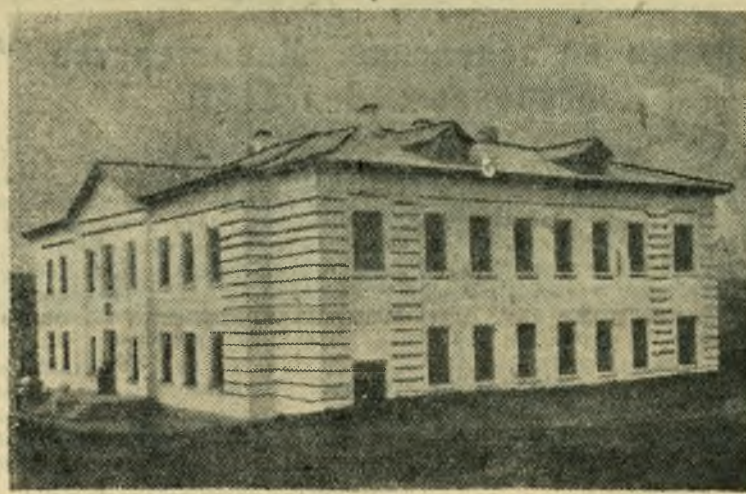
В селе Кашпир накануне нового учебного года сдана в эксплуатацию новая школа, построенная Сызранским строительным участком треста «Куйбышевсельстрой».

1 сентября 280 учащихся приступили к занятиям в новом школьном здании.