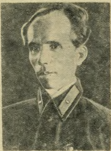
НА СНИМКЕ: Н. А. Островский.

бы, требующих большого напряжения физических и духовных сил, больших жертв, подлинного героизма, находилась будущий писатель. И где бы он ни был — в кавалерийской бригаде Котовского или на комсомольской работе и на трудовом фронте, когда в невыносимо тяжелых условиях восстанавливали разрушенное войной хозяйство страны, — всюду он был впереди и, преодолевая стужу, недоедание, острую физическую боль, учил комсомольцев мужеству. В любой обстановке Н. Островский отдавал Родине все возможное. Когда в 1927 году мучительная болезнь, полученная в результате контузии на фронте, обрекла 23-х летнего Островского на неподвижность, а вслед за этим пришла полная слепота, он сумел сделать свою жизнь полезной для Родины, он стал писателем.