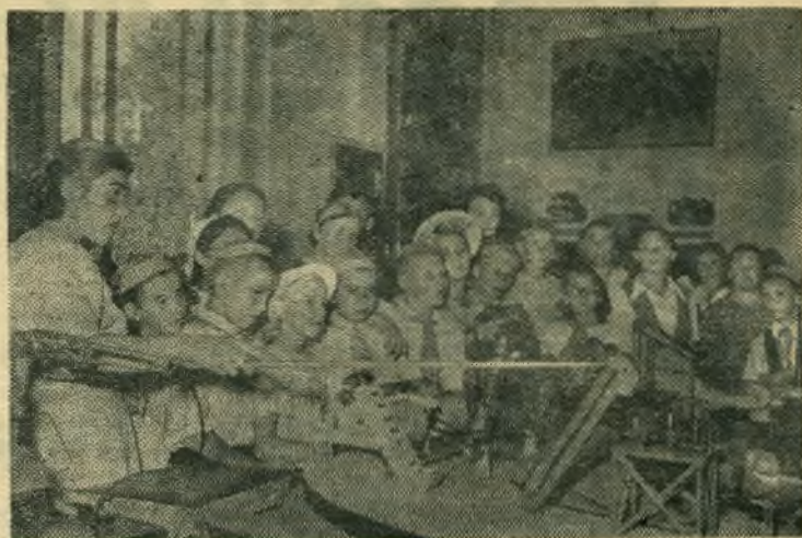
Москва. Всесоюзная сельскохозяйственная выставка. В павильоне Юных натуралистов школьники из Московской области знакомятся с экспонатами — действующими моделями сельскохозяйственных машин.

Торжественно и могуче звучит в зале музыка песни «Москва-Пекин» — песни дружбы китайского и советского народов.