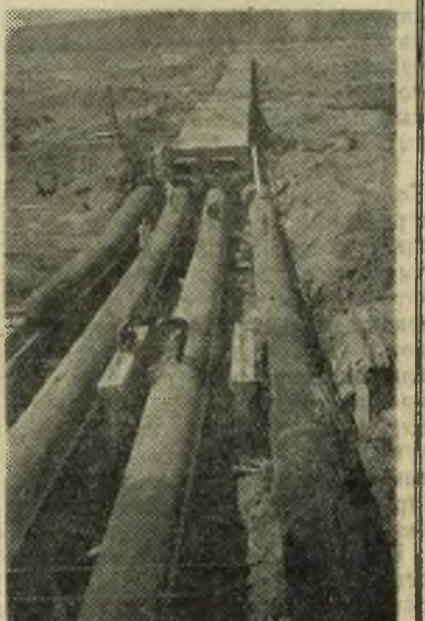
НА СНИМКЕ: укладка трубопроводов насосной станции.

Азербайджанская ССР. Широко развернулось строительство второй очереди Самур-Дивиченского канала. Новая водная магистраль протянется на 84 километра. Строители, оснащенные мощной техникой, сооружают плотины, водоприемники, отстойники, насосные станции, водосбросы и другие гидротехнические сооружения.