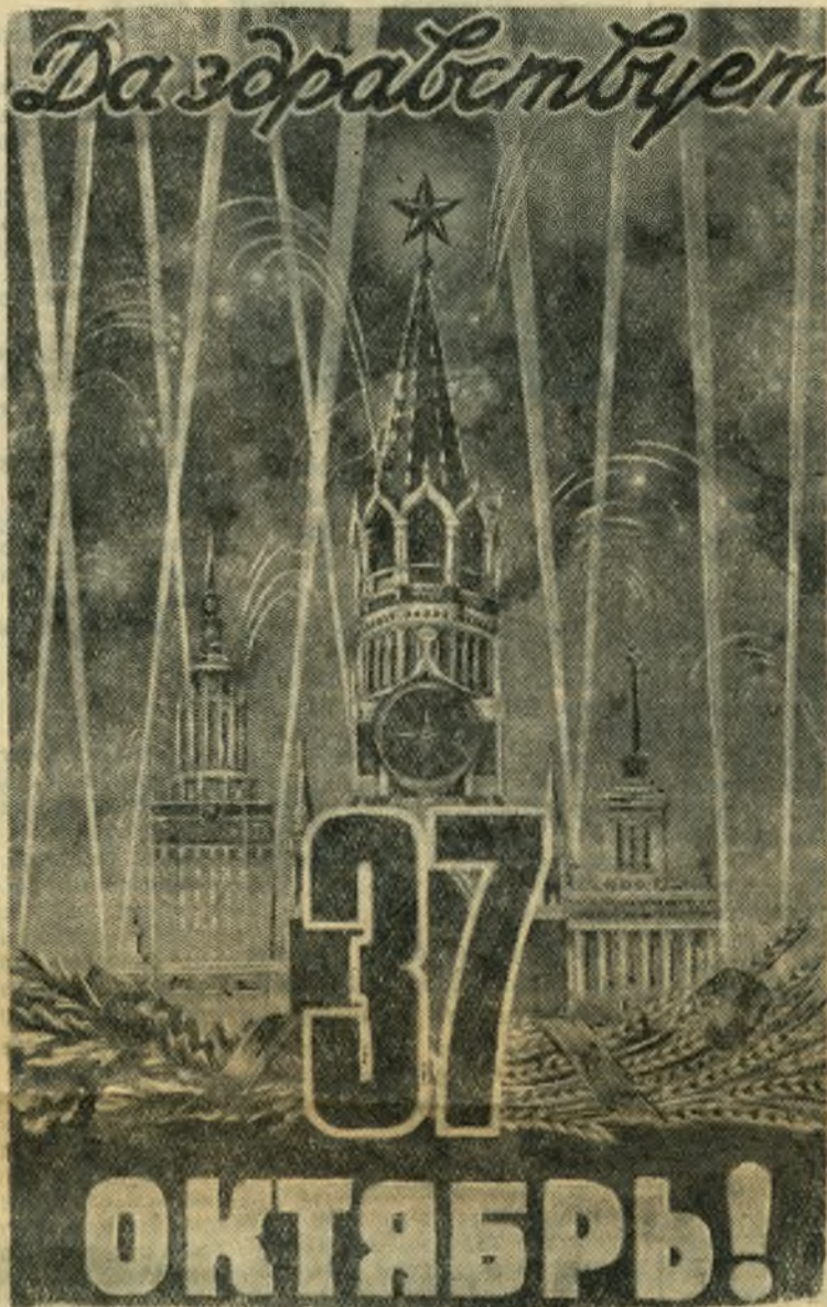
Плакат художника А. Антонченко, выпущенный Государственным издательством изобразительного искусства.

Да здравствует 37-я годовщина Великого Октября!