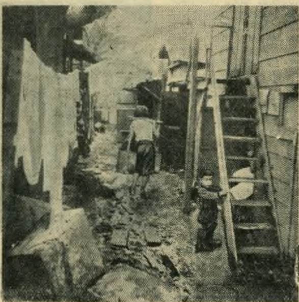
Токио. Жилье бедняка у парка Уэно.