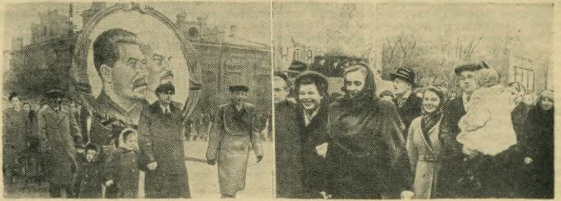
Демонстрация трудящихся на площади имени Ленина.