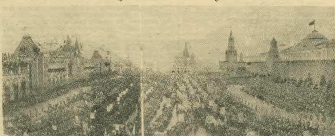
Москва, 7 ноября 1954 года. Празднование 37-й годовщины Великой Октябрьской социалистической революции. Демонстрация представителей трудящихся на Красной площади.

Цветами и кумачом убраны эмблемы автозавода имени Сталина, заводов «Динамо», «Красный протарий», комбината имени Шербакова и других передовых предприятий, выступивших в канун праздника с патриотическим починком — досрочно выполнить пятую пятилетку! Он подкреплен большими реальными делами. На алых полотнищах слова: