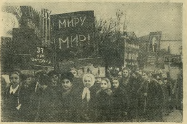
Школьники на праздничной демонстрации.

Демонстрация трудящихся в честь 37-й годовщины Великой Октябрьской социалистической революции вновь показала безграничную верность и преданность трудящихся города родной Коммунистической партии и Советскому правительству, их стремление настойчиво и последовательно бороться за построение коммунистического общества, за прочный и длительный мир. Демонстрация показала славное и нерушимое единство партии, правительства и народа.