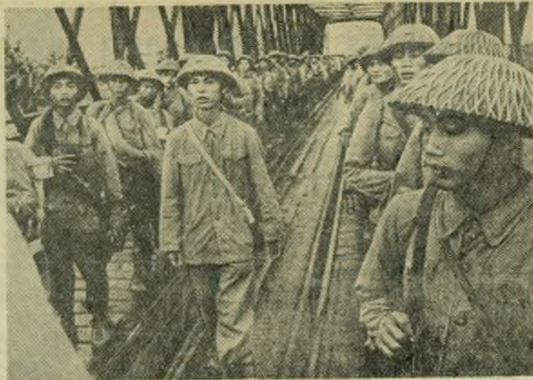
Недавно состоялась передача Вьетнамской Народной армии города Ханоя—столицы Демократической Республики Вьетнам.

БУДАПЕШТ, (ТАСС). Здесь открылась выставка венгерского приборостроения, в которой участвуют 17 заводов, представивших свыше 400 экспонатов, в том числе 57 приборов, изобретенных за последние годы. В числе экспонатов — электрические, оптические, радио и другие приборы и аппараты для различных отраслей промышленности, сельского хозяйства, медицины и др.