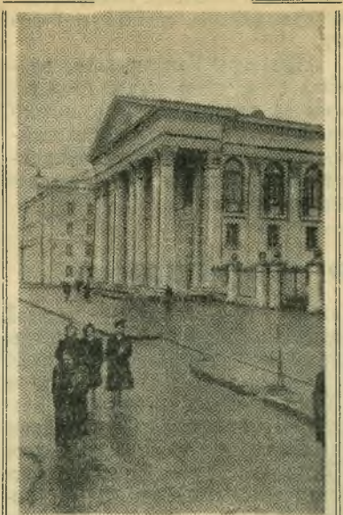
В Калинин построено здание областной библиотеки имени А. М. Горького. Оно прекрасно оборудовано. Библиотека имеет четыре читальных зала на 620 мест, шестиэтажное книгохранилище. Здание построено по проекту архитектора И. П. Изотова. НА СНИМКЕ: здание библиотеки имени А. М. Горького.

300 предложений рабочих уже внедрено в производство. Они дают заводу свыше 200 тысяч рублей годовой экономии. (ТАСС).