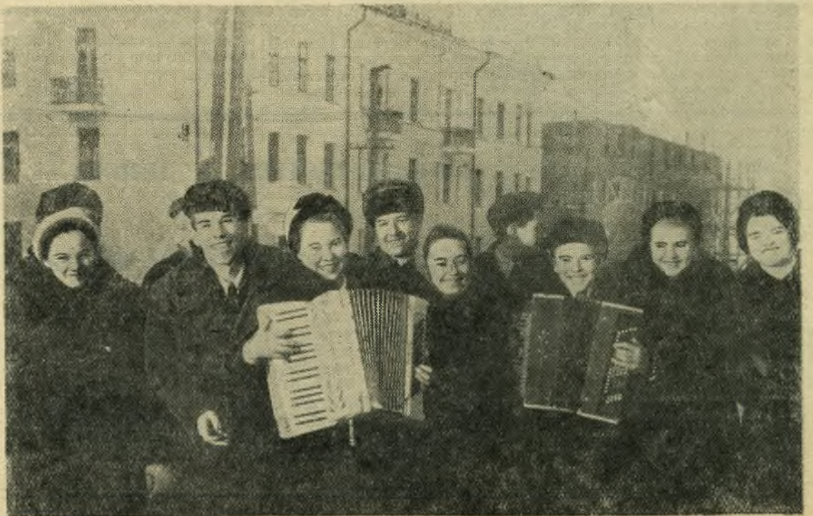
С песнями идут голосовать молодые избиратели...

Дружно и организованно идет голосование. К концу дня в этом избирательном пункте проголосовало 99 процентов избирателей.