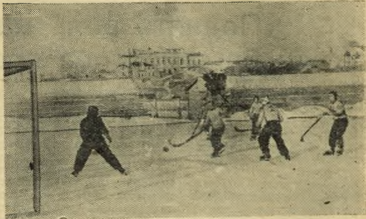
На стадионе «Торпедо».