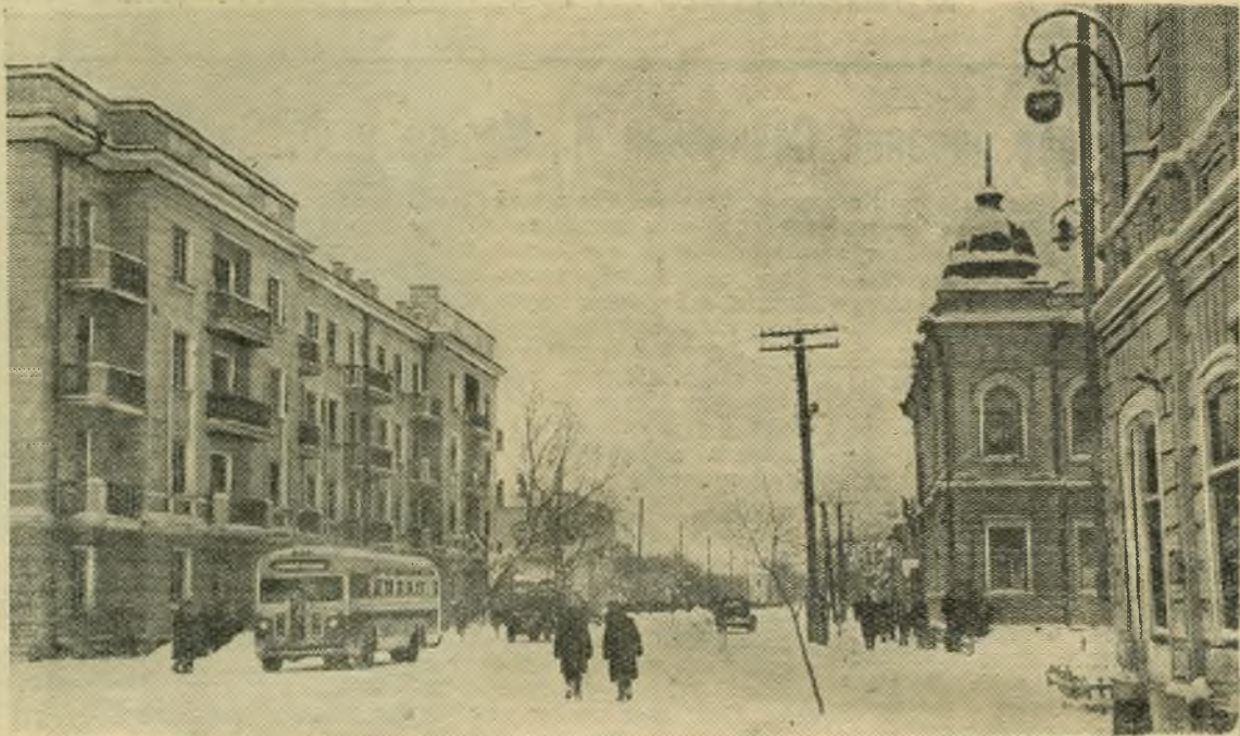
НА СНИМКЕ: Советская улица.