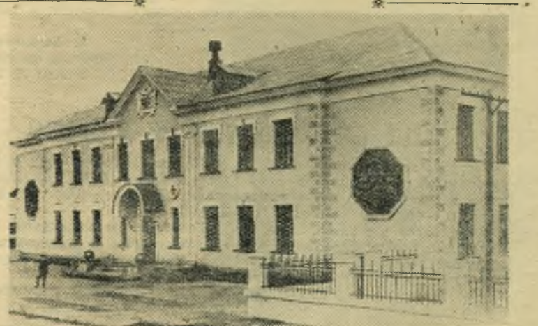
НА СНИМКЕ: здание средней школы № 28 в поселке «Строитель», построенное в 1954 году.