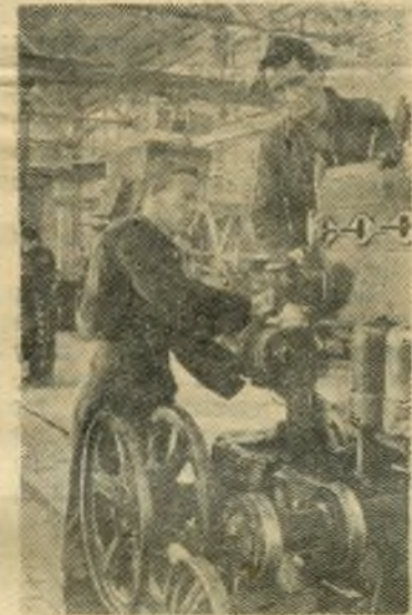
Свердловская область. Сотни инженеров, техников и механизаторов Нижнего Тагила выехали на работу в деревню. Только в Никола-Павловскую МТС из города пришло 20 специалистов и 30 механизаторов. Они принесли с собой высокую производственную культуру.

Желание ехать на работу в район целинных и залежных земель выразили свыше ста молодых железнодорожников Белорусской железной дороги.