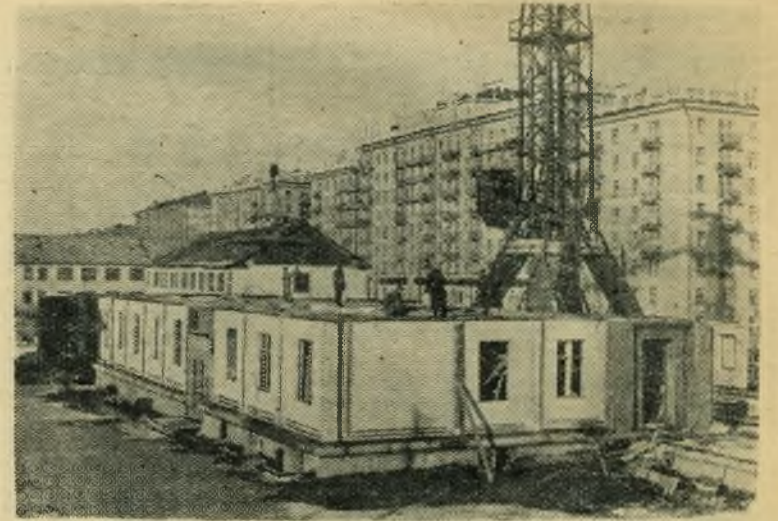
На 6-й улице Октябрьского поля сооружается первый в Москве бескаркасный крупнопанельный жилой дом. Бескаркасное крупнопанельное домостроение открывает большие возможности для индустриализации строительства, широкого применения железобетонных конструкций и деталей, позволяет превратить строительную площадку в сборочно-монтажную. Дом полностью собирают из изготовляемых на заводе крупных железобетонных деталей. Затраты труда при сооружении такого дома уменьшаются в три-четыре раза по сравнению со строительством кирпичного здания.

НА СНИМКЕ: монтаж первого этажа крупнопанельного дома на 6-й улице Октябрьского поля.