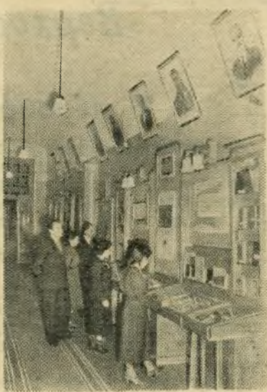
Москва. В Государственной публичной исторической библиотеке открыта выставка, посвященная 50-летию первой русской революции 1905—1907 годов.