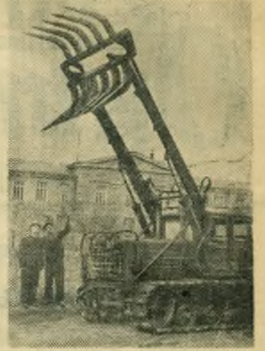
Харьков. На заводе дорожных машин изготовлен погрузчик «М-4» Новая машина предназначена для погрузки срезанного кустарника, древесины и выкорчеванных пней. Грузоподъемность погрузчика до 500 килограммов при подъеме на высоту 3,5 метра. Производительность в смену погрузчика 100—120 кубических метров древесины.