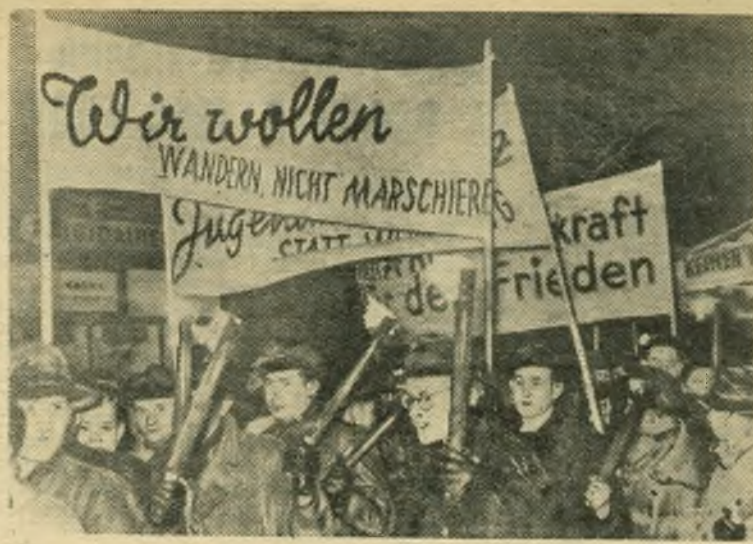
Трудящиеся Западной Германии не желают участвовать в реваншистской войне. Во многих городах Западной Германии проходят митинги и демонстрации протеста против проводимой боннским правительством политики восстановления вермахта. Недавно в Бремене состоялась демонстрация против ремилитаризации Западной Германии и возрождения вермахта. НА СНИМКЕ: демонстранты на улицах Бремена.

Выступление западногерманских рабочих является серьезным предупреждением для боннских реваншистов, пытающихся навязать Западной Германии парижские соглашения и ввергнуть ее в военные авантюры. Н. Захаров.