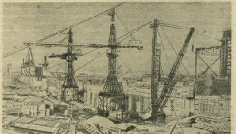
На строительстве Горьковской ГЭС. Общий вид котлована, где воздвигается главное здание гидроэлектростанции и водосливная плотина.