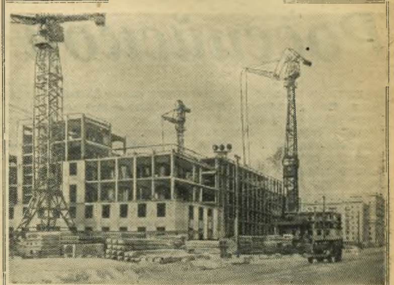
Москва. В районе Песчаных улиц идет строительство карнасно-панельных домов, собираемых из бетонных и железобетонных деталей, изготовляемых на заводах. НА СНИМКЕ: на строительстве карнасно-панельных домов в районе Песчаных улиц.

ЛОНДОН, 18 февраля. (ТАСС). Корреспондент агентства Рейтер сообщает из Карачи, что в ходе турецко-пакистанских переговоров, как полагают, будут приняты важные решения, касающиеся расширения «оборонительной системы» на Среднем Востоке, и, в частности, методов вовлечения в эту систему арабских стран и Ирана.