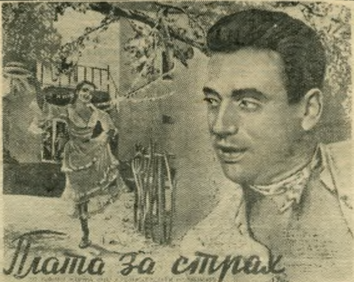
Plata за страх

НА ЭКРАНАХ ГОРОДА «Художественный» Новый цветной художественный фильм «МОРЕ СТУДЕНое» «Звезда»