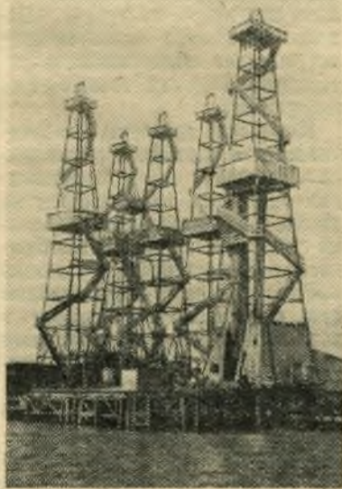
Баку. На морских нефтяных промыслах широко применяется так называемое кустовое бурение. Проходка нескольких нефтяных скважин ведется наклонно-направленным способом с одной площадки. Этот способ позволяет с меньшими затратами осваивать нефтеносные площади, находящиеся на дне Каспийского моря. С одной такой площадки пробуривается до 10 нефтяных скважин.