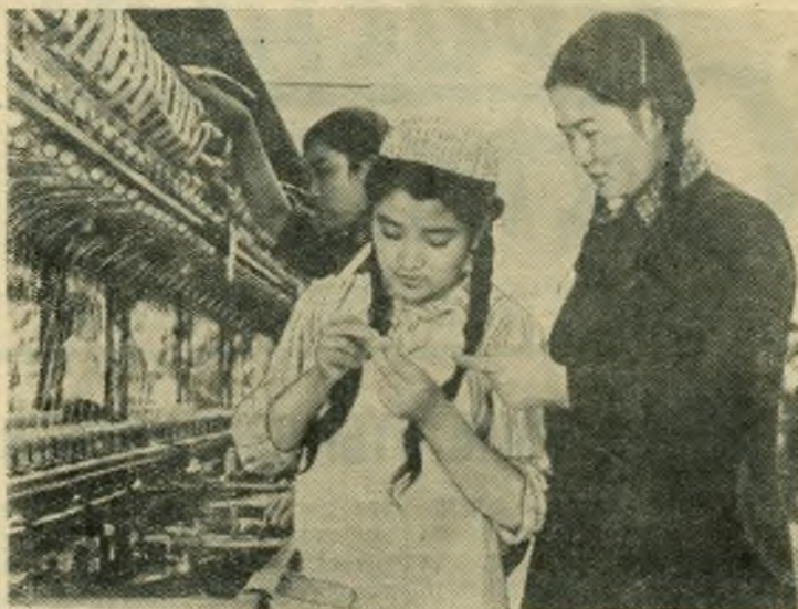
Китайская Народная Республика. В южной части провинции Синьцзян сооружается государственная шелкоткацкая фабрика. Первая очередь предприятия вступила в эксплуатацию. К 1956 году мощность фабрики удвоится. Провинция Синьцзян издавна славится как центр шелкоткацкой промышленности. Живущие здесь уйгурки известны как умелые прядильщицы. Сейчас они успешно осваивают современные станки.

НА СНИМКЕ: инструктаж в цехе новой фабрики.