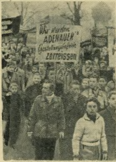
НА СНИМКЕ: молодые патриоты из Западного Берлина с лозунгами против военных планов Аденауэра.